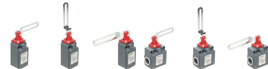
FM 18C1 ⊕ FM 18C2 ⊕ FM 18C3 ⊕ FZ 18C1 ⊕ FZ 18C2 ⊕ FZ 18C3 ⊕ FM 9C1 ⊕ FM 9C2 ⊕ FM 9C3 ⊕ FZ 9C1 ⊕ FZ 9C2 ⊕ FZ 9C3 ⊕ FM 20C1 ⊕ FM 20C2 ⊕ FM 20C3 ⊕ FZ 20C1 ⊕ FZ 20C2 ⊕ FZ 20C3 ⊕