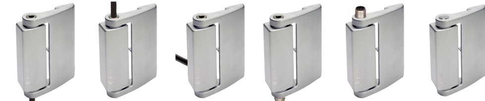
HP AB052F-2SN ⊕ HP AB052F-2AN ⊕ HP AB052F-2PN ⊕ HP AB052F-KSM ⊕ HP AB052F-KAM ⊕