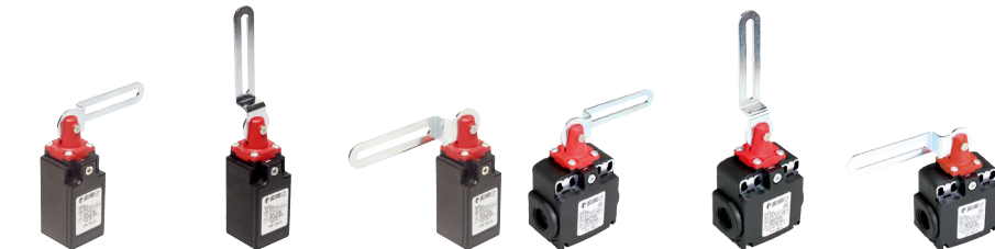
FR 18C1 ⊕ FR 18C2 ⊕ FR 18C3 ⊕ FX 18C1 ⊕ FX 18C2 ⊕ FX 18C3 ⊕ FR 9C1 ⊕ FR 9C2 ⊕ FR 9C3 ⊕ FX 9C1 ⊕ FX 9C2 ⊕ FX 9C3 ⊕ FR 20C1 ⊕ FR 20C2 ⊕ FR 20C3 ⊕ FX 20C1 ⊕ FX 20C2 ⊕ FX 20C3 ⊕