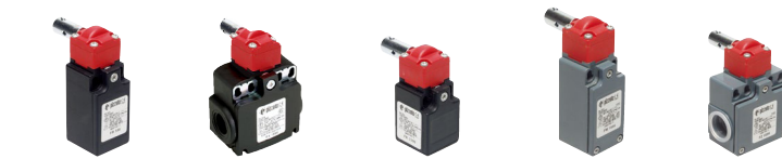
FR 1896 ⊕ FX 1896 ⊕ FK 3396 ⊕ FM 1896 ⊕ FZ 1896 ⊕ FR 996 ⊕ FX 996 ⊕ FK 3496 ⊕ FM 996 ⊕ FZ 996 ⊕ FR 2096 ⊕ FX 2096 ⊕ FM 2096 ⊕ FZ 2096 ⊕