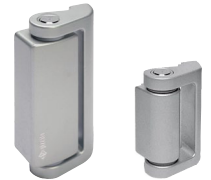
HC AA HC LL